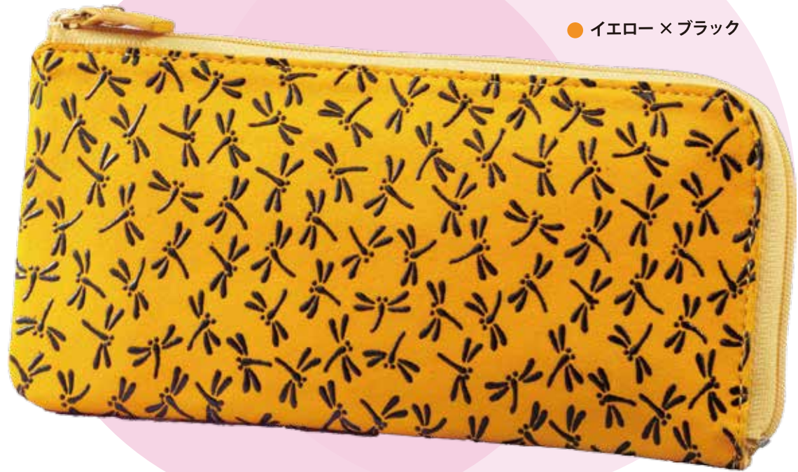
●カード入れ×14 ●札入れ×1 ●オープンポケット×1 ●外側ファスナーポケット×1