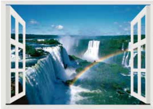
イグアスの滝（イグアス国立公園）

美しく壮大で悠久な歴史や自然は時を経ても尚見る人の多くを癒してくれるはず。ゆったりと湯船につかりながら心ゆくまで、景色をご堪能いただけます。