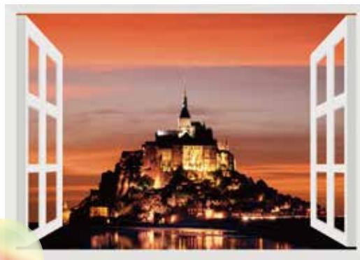
モンサンミッシェル（モンサンミッシェルとその湾）