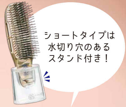
ショートタイプは 水切り穴のある スタンド付き！

[JANコード] ショート：4580197744155 / ロング：4580197744148