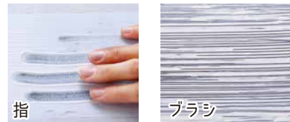
ブラシなら指では届きにくい箇所まで細かく行き届きます。