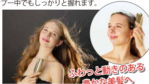
ふわっと動きのある 豊かな美髪へ